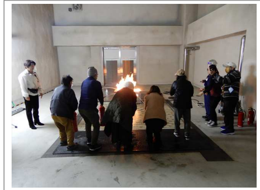
防災体験の社会見学