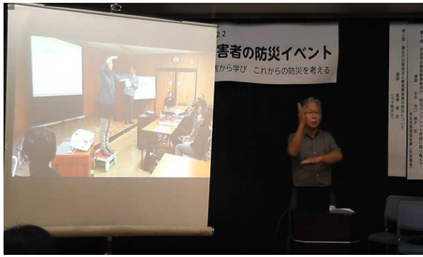
聴覚障害者のための防災イベント